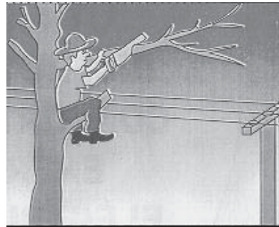
Antes de podar árboles cercanos a líneas eléctricas consúltenos.

visible o algún cable caído, no dude en dar aviso a la guardia de la CEM. No intente solucionar el inconveniente por sus propios medios, ya que eso puede ocasionar serios accidentes y posibles riesgos para su salud. Para comunicarse con la guardia debe llamar al teléfono 405-069 o 405-236 interno 100.