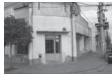
Traslado de la oficina de telefonía.

A principios de agosto se trasladó la oficina de telefonía a la esquina de Eva Perón y Pedro N. López, a pasos de la oficina inicial. La idea es brindar un mejor servicio ya que esta nueva dependencia es más amplia que la anterior. De a poco se está adaptando el lugar para hacerlo más cómodo y para que los socios tengan siempre una mejor atención.