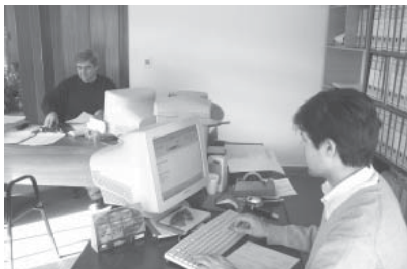
Servicio personalizado para brindarle soluciones rápidas y eficientes.

amplió el plantel externo correspondiente a los barrios Coppola, Luján, Los Claveles, Montemar, El Tala, Unidad Nacional y San José. En cada uno de estos barrios se amplió la disponibilidad de pares existentes con lo cual se puede dar servicio con normalidad. Además, se dejaron previstos pares adicionales para los barrios que en este momento se están construyendo, tanto el que está frente a Petroquímica Argentina como los dos emplazados detrás del barrio Unidad Nacional.