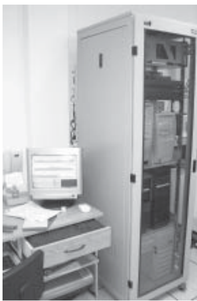
Varias vistas de la central telefónica principal. Equipos de última tecnología.